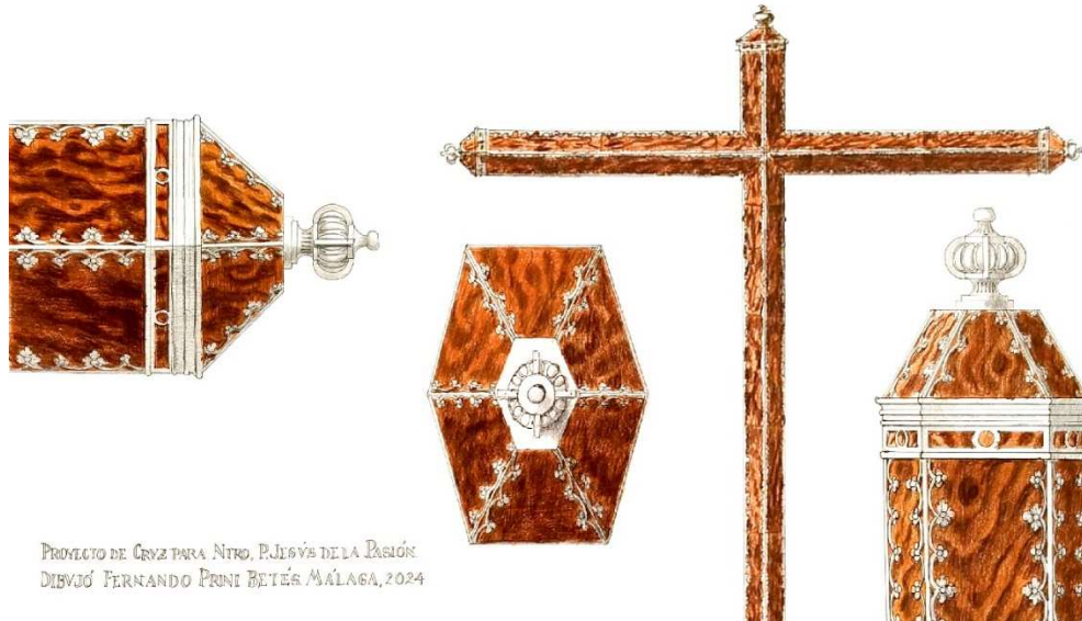
PROYECTO DE CRUZ PARA NTR. P.JESÚS DE LA PASIÓN DIBUJÓ FERNANDO PRINI BETÉS MÁLAGA, 2024

En primer lugar, la cruz procesional que portará el nazareno inspirada en la que llevaba la antigua imagen del Señor hasta el año 1977, representa la transición de una imagen a otra, manteniendo siempre la misma advocación de Pasión.